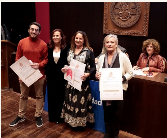
Colegios Oficiales de Enfermería de Zaragoza, Huesca y Teruel

La Junta de Centro de la Facultad de Ciencias de la Salud, en su sesión de 4 de noviembre de 2024, acuerda otorgar el Reconocimiento de la Facultad de Ciencias de la Salud a los Colegios Oficiales de Enfermería de Zaragoza, Huesca y Teruel, al Colegio Profesional de Fisioterapeutas de Aragón y al Colegio Oficial de Terapeutas Ocupacionales de Aragón, por su labor en la ordenación del ejercicio de la profesión, orientada hacia la excelencia de la práctica profesional como instrumento para la mejor atención de las necesidades de la salud de la población y del sistema sanitario y socio-sanitario, así como en la representación y defensa de los intereses de sus profesionales