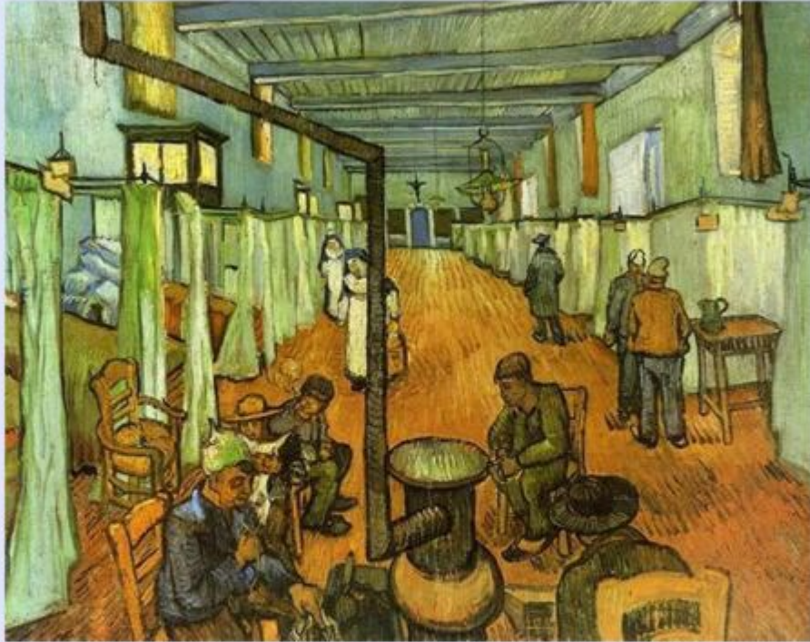
Dormitory at the Hospital in Arles, 1889 by Vincent Van Gogh

Facultad de Ciencias de la Salud Universidad Zaragoza